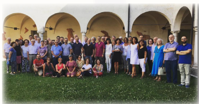
Uno scatto dall'edizione 2018