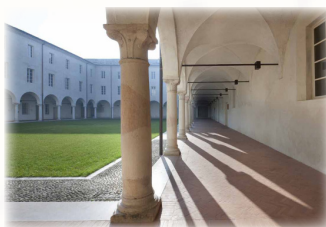
Il Conservatorio: sede del Corso

Il repertorio oggetto di studio sarà il seguente: - dal proprio della XV domenica del Tempo Ordinario: IN. Dum clamarem , GR. Custodi me, Alleluia. Te decet hymnus , OF. Ad Te, Domine, levavi , CO. Qui manducat ; - ordinario dalla Missa V (con Gloria More ambrosiano ).